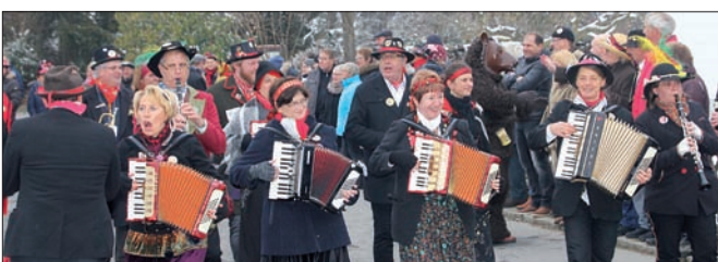
Stellvertretend für die vielen musikmachenden Formationen: die Zigeunergruppe der Narrengilde Reute und der Fanfarenzug Reute. Selbstverständlich waren auch die Durlasbach-Schalmeien und der Musikverein Reute-Gaisbeuren bei der Fasnet der Närrischen Gaisbeurer dabei.