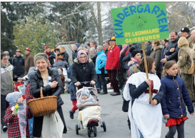
Gaisbeurens Kindergarten nahm mit einer stattlichen Zahl von Kindern, Erzieherinnen und Eltern teil. Dieses Jahr lautete das Motto „Ritter und Prinzessinnen“.